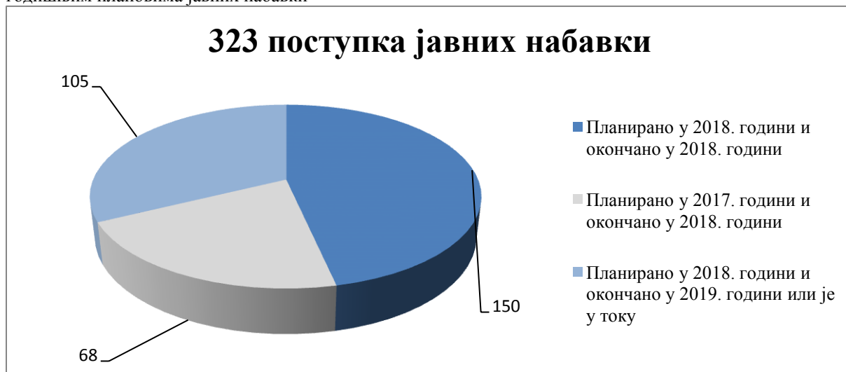
Дијаграм број 1: Приказ поступака јавних набавки које је Установа спроводила у 2018. години по годишњим плановима јавних набавки

У наредној табели следи преглед поступака јавних набавки велике вредности који су обухваћени у поступку ревизије: